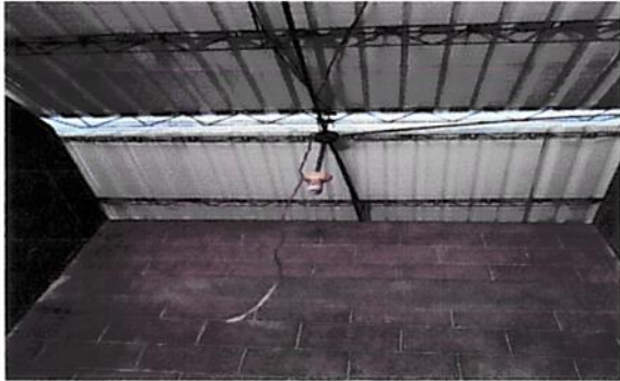
Foto1: Falta de cabiado Electrico